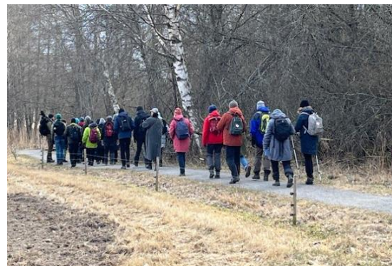
Ett stort gäng guidas i Sandemar

Tack vare en satsning på kommunikation har marknadsföringen ökat i sociala medier och andra kanaler. Det har också inneburit en ny och mer interaktiv design på månadsprogrammet. Programmet skickas ut till alla medlemmar i Stockholms län via månadsbladet, men också via en egen mejllista, bland annat till kalendarier. Även hemsidan utinaturen.nu har uppdaterats och mobilanpassats.