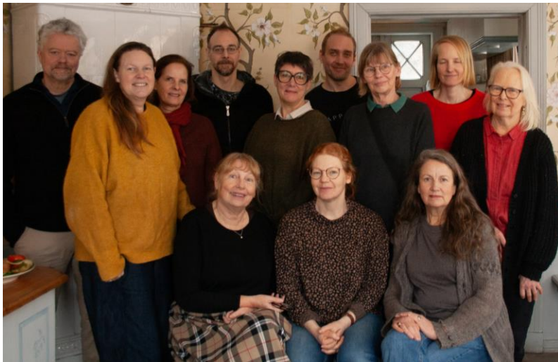
Naturskyddsföreningens styrelse och kansli 2025

Regionala verksamhetsutvecklare (VU) i föreningen ordnar digitala möten generellt varannan vecka, där Länsförbundet Stockholms verksamhetsutvecklare har deltagit vid flera. Mötena syftar till att hjälpa till att informera om hur VU kan arbeta, utbyta information och kunskap samt hitta möjliga former för samarbeten. VU har löpande kontakt med verksamhetsutvecklaren för Fältbiologernas distrikt Stockholm-Uppland-Gotland.