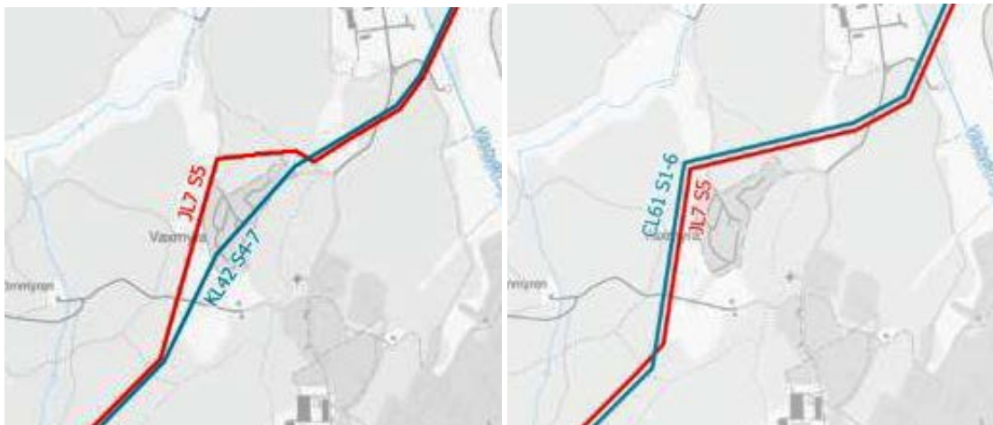
Bild 2. SvKs byggnation utanför odlingslottområdet är i verkligheten en sicksackdragning i skogs- och hagmark utanför de gamla gårdarna Lövsta, Vaxmyra och Långtomten. Notera att SvKs ledning ritas som en tunn grön linje medan Trafikverkets betydligt mindre kraftledning ges en tydlig röd färg. Ett träffande exempel på undermålig detaljeringsgrad som SvK redovisar i många kartor.