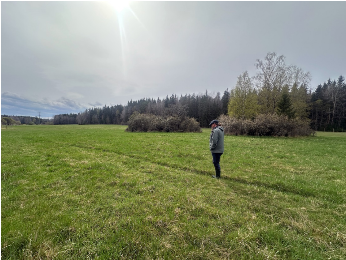
Bild 1. Vaxmyra ängar, april 2025. Ett mycket vackert och ursprungligt landskap som såväl SvK som Ei totalt negligerar. Hästhagar sommartid, uppskattad för skidåkning vintertid redan vid ringa snötillgång. Rakt fram och till höger i bilden har Ei bryskt gett SvK koncession att placera två av sina gigantiska hörnstolpar för att kunna anlägga sin nya kraftledningsgata sicksack utanför odlingslottområdet. Skogsbrynet till höger i bild avverkas och ersätts av en ny ledningsgata. Det är ett oacceptabelt intrång i en av Upplands Väsby's sista kvarvarande vackra naturmiljöer med bl.a. påvisat mycket höga naturvärden.

Vad myndigheter inte tycks ha förstått är att de är på god väg att tillsammans med ett fåtal intressenter konvertera Upplands Väsby till ett oattraktivt storskaligt produktions- och industrilandskap. Påvisade allvarliga felaktigheter och felbedömningar som ligger till grund för Ei's koncessionsbeslut har Ei nu haft chans att motivera, men gör inte det. Svenska kraftnät lämnar å sin sida allttjämt felaktig och ofullständig information om sin negativa påverkan. Ei's beslut att tillåta SvK att bygga sin nya 420 kV kraftledning sicksack förbi och precis utanför Vaxmyra odlingslottområde måste ändras för att inte oersättliga natur-, kultur- och hälsovärden ska spolieras. Svenska kraftnät har sin ledningsgata sedan decennier – och till allas fulla medvetande – redan utpekad och beredd genom en rakare och betydligt mindre skadlig dragning genom Vaxmyra odlingslottområde. Det måste finnas en rimlighetsbedömning i juridiska beslut som har mycket stora konsekvenser, oavsett vilken geografisk yta de inverkar på. Att i detta läge tillstyrka Ei's koncessionsbeslut gällande SvKs befintliga ledningsgata och negligera detaljplanen för Vaxmyra är inte rimligt. Framför allt inte när såväl tunga remissinstanser som existerande områdesbestämmelser föreskriver fullständig framkomlighet för ledningsägaren ifråga genom Vaxmyra odlingslottområde och när kraftbolaget i andra sammanhang köpt in hela åretruntboende fastigheter.