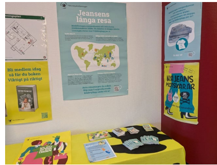
Miljövänliga Veckan Max 5