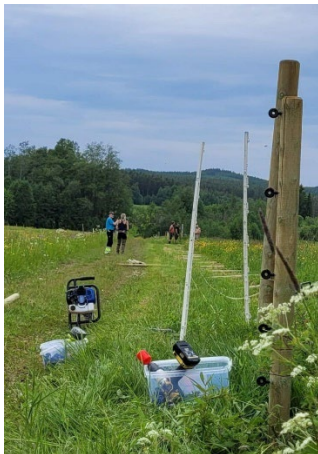
Rovdjursstängsling i Djura