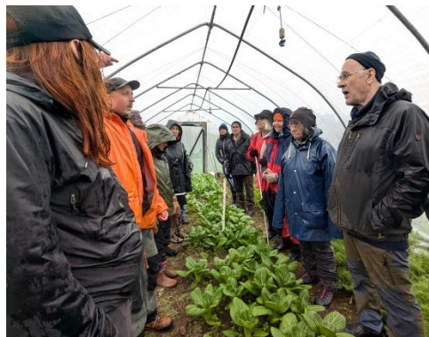
Studieresa till Rikkenstorp