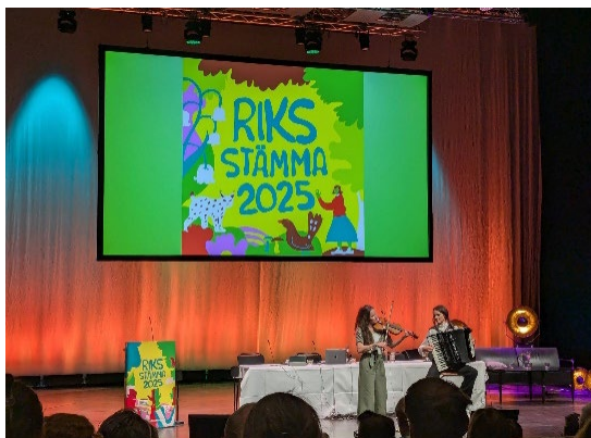
Riksstämma i Gävle