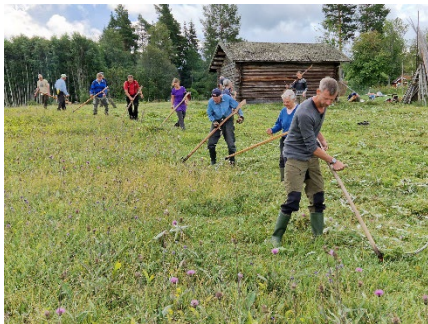
Slätter i Orsa

Regionkansliet har samordnat kretsarnas aktiviteter. Detta har bland annat inneburit att lägga ut information på webben och skicka pressmeddelanden inför t ex Klädbyttardagen, Fågelskådningens dag, Den Biologiska mångfaldens dag, Naturnatten, Ängens dag (slätter), Green Action Week/Miljövänliga Veckan och Skogsdagarna. Här kommer några bilder från sådana lokala aktiviteter: