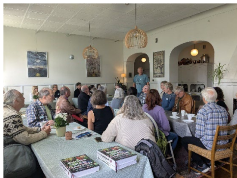
Höstupptakt & skogsträff på Lindsberg