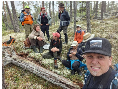
Skogsinventeringskurs vid Fulufället