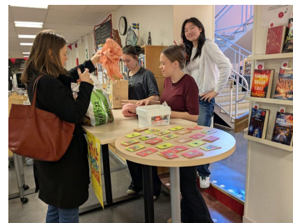
Kläd- och prylbyttardag Mora