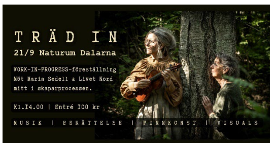
Skogsföreställning på naturum Dalarna