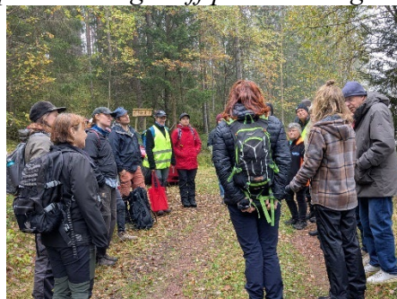
Uppstartsträff i Älvdalen