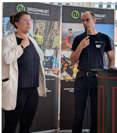
Fjällkonferens i Älvdalen

Länsförbundets styrelse har haft sju möten under 2025. Två av dessa var fysiska och fem var digitala. Några möten med andra ordföranden i naturorganisationer i Dalarnas har hållits om gemensamma frågor.