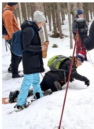
Spåringskurs i Hanebo