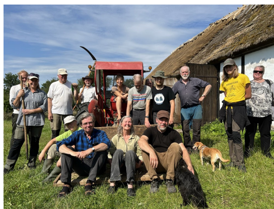
I år blir slättern i stubbskottsängen 8-9 augusti

Vi brukar börja arbetsdagarna vid kl 10 och hålla på till 15. Föreningen står för fika, men ta med egen lunch. Vi har alla redskap. Samåkning kan ordnas.